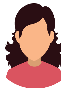
Mujer y personas transgénero